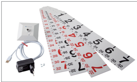
> Lieferumfang/Delivery contents

Die Zahlen geben die Winkelgrade an. Im Zentrum der Skala befindet sich ein punktförmiges LED-Fixierlicht, das sich bei der Untersuchung in Augenhöhe genau gegenüber dem Patienten befinden sollte.